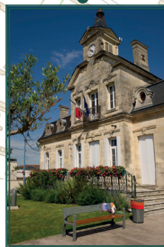
Hôtel de ville