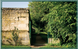
Entrée du parc par l'arrière de l'église romane