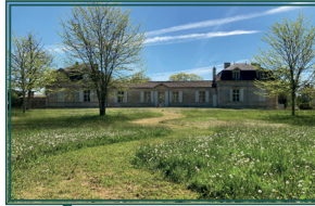
BOMA : la Chartreuse