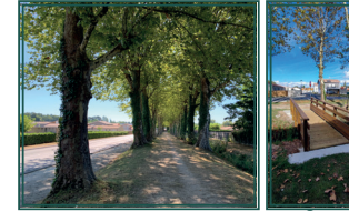
Allée des platanes centenaires