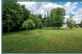
BOMA : le parc