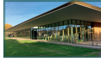
BOMA : la médiathèque